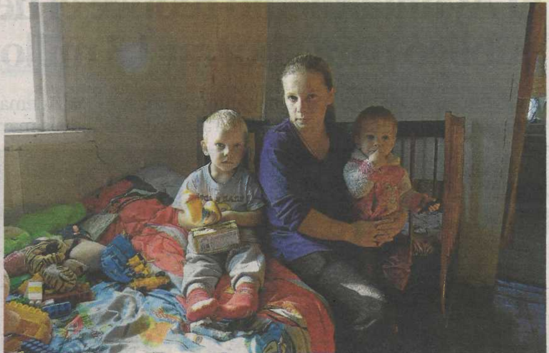
Fundación Ibercaja está llevando a cabo diferentes iniciativas de ayuda en sus centros.

Por otra parte, desde el centro Ibercaja La Rioja se ha organizado una recogida de enseres y alimentos que serán enviados por la ONG Coopera y el colectivo Ucrania-Rioja, y Cruz Roja hará uso de las aulas informáticas y reservará varias plazas en las ludotecas para los niños acogidos. Junto con Cáritas Diocesana se les ofrecerá preferencia de acce-