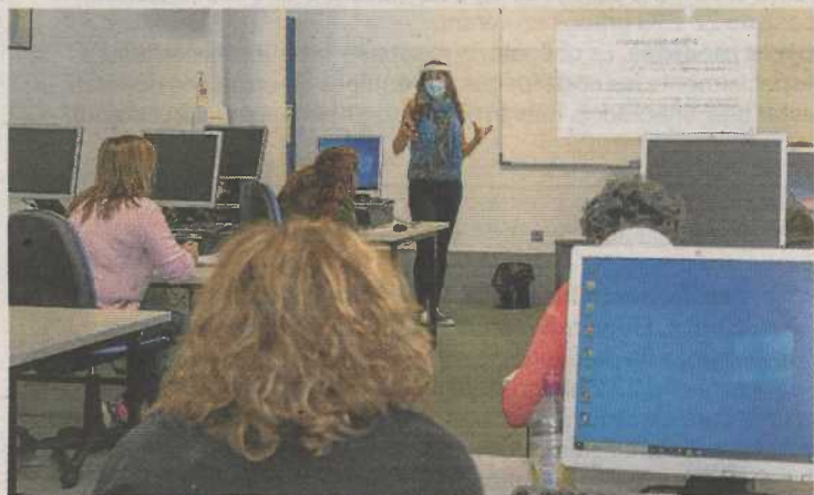
Fundación Dfa imparte numerosos cursos formativos.

Fundación Dfa prepara, para finales de este mes, nuevas acciones formativas gratuitas dirigidas a personas trabajadoras prioritariamente desempleadas. El día 30 de marzo está previsto que dé comienzo el curso para el certificado de profesionalidad 'Docencia de la Formación Profesional para