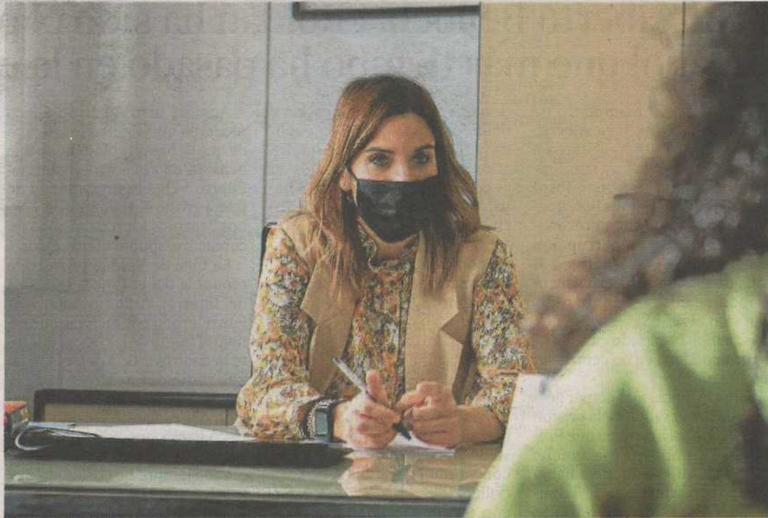
Los profesionales del departamento infanto-juvenil de Asapme se encargan de atender cada caso.