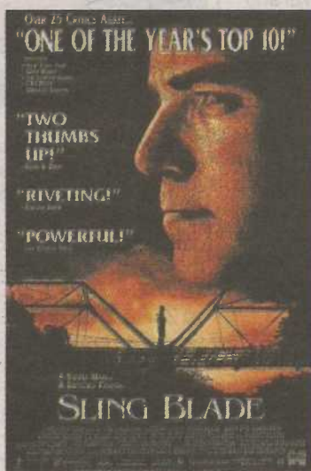
Fotograma de la película.

Mañana, 26 de marzo, se proyectará la película 'El otro lado de la vida', de Billy Bob Thornton, una historia que Discapacitados sin Fronteras ha elegido para que forme parte de la XXIII edición del ciclo de Cine y Discapacidad. La cita será, a las 18.00, en el centro Joaquín Roncal. Al finalizar la proyección habrá un tiempo de debate y coloquio con profesionales que abordarán diferentes cuestiones relacionadas con el tema que trata esta película. La entrada será libre hasta completar el aforo.