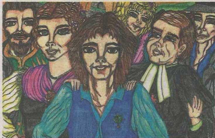
Ilustración de los personajes del libro en lectura fácil.

El objetivo del proyecto es acercar la cultura, las tradiciones y la historia de Aragón a las per-